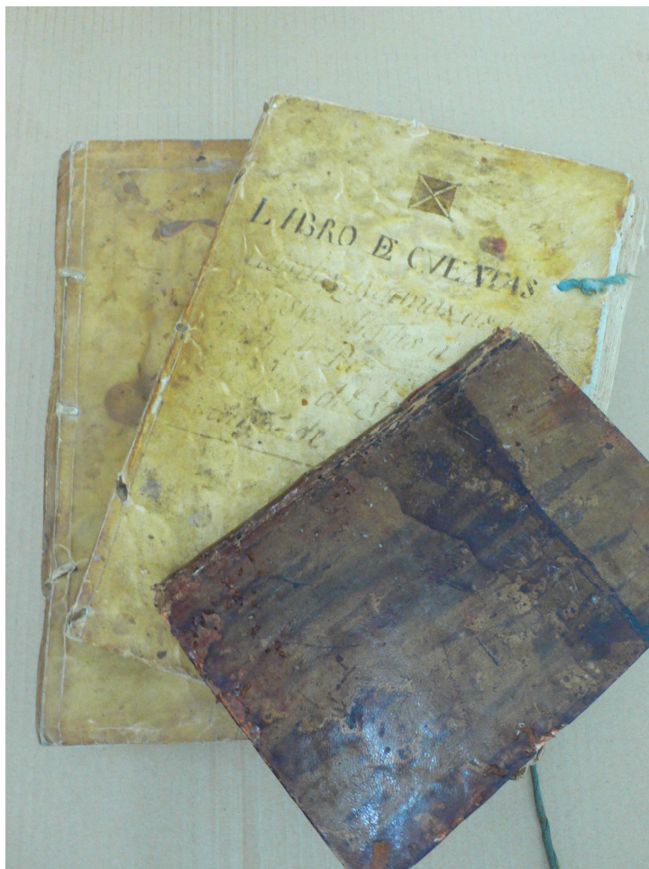
Fotografía 2. Ingreso extraordinario de documentación. 2005