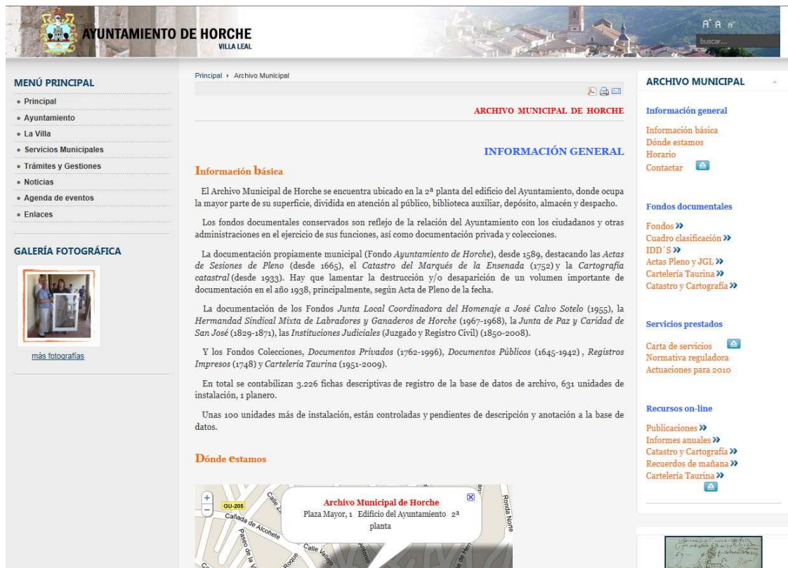
Fotografía 4. Apartado web, Archivo Municipal