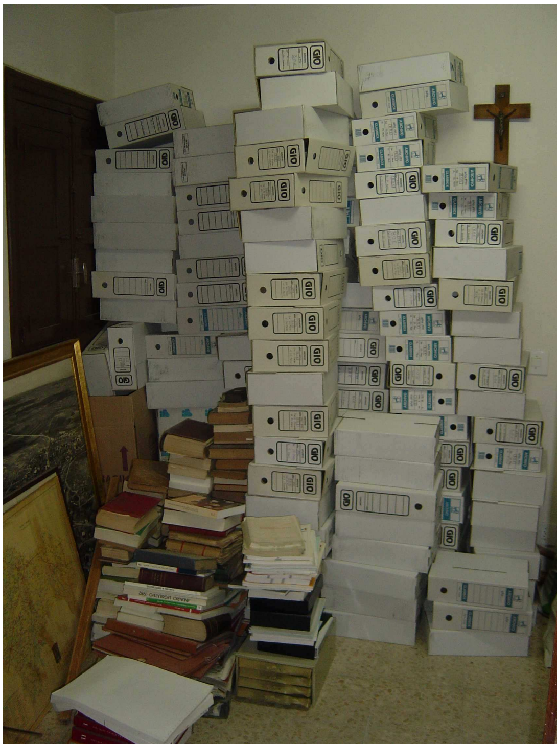
Fotografía 1. Depósito del AMH, estancia auxiliar, 2003. El depósito cuenta con 2 estancias auxiliares, ésta dedicada a despacho del Técnico ya desde 2007 y otra a almacén.

Rememorando así, se observa que de manos del Archivo – Biblioteca de la Excma. Diputación Provincial de Guadalajara, se hizo un breve estudio de las posibilidades y recursos que el Ayuntamiento de Horche necesitaba para colmar sus expectativas de lograr que la hasta entonces documentación almacenada sin criterios archivísticos, tal y como cualquier manual los define, pasara a tomar forma de depósito de archivo y tuviese